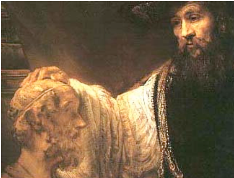
Aristote contemplant un buste d'Homère, 1653 – Rembrandt, MET New York

École normale supérieure* - Salle des actes