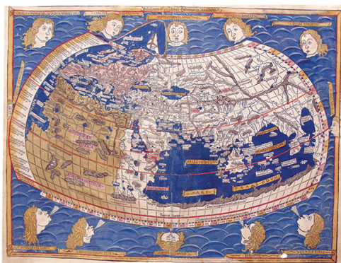
Ptolemy map 15th c.

mardi 14 avril , 17h30-19h30, salle F, ENS (45, rue d'Ulm, 75005 Paris)